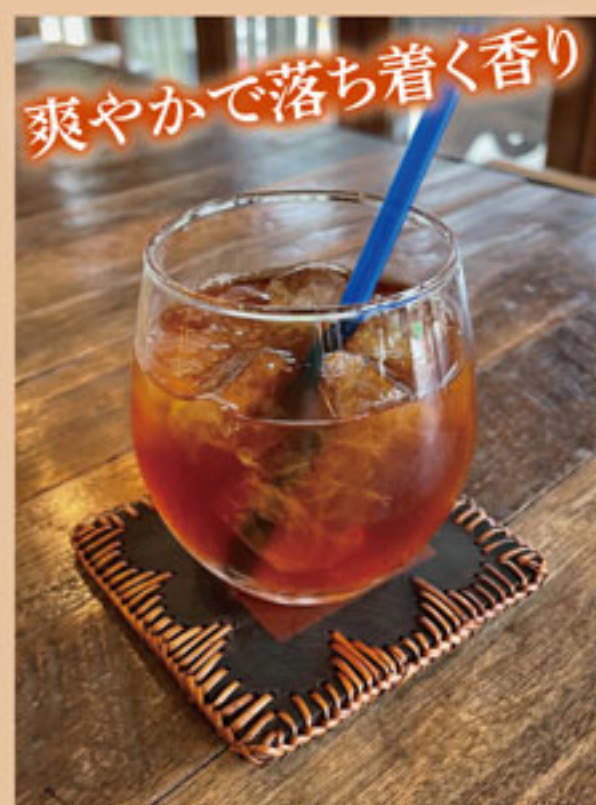
アールグレイのアイスティー