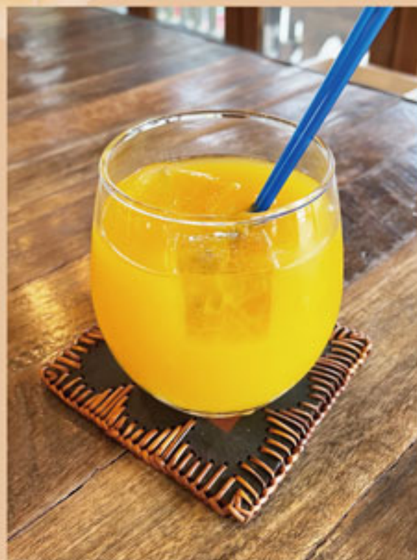
マンゴージュース