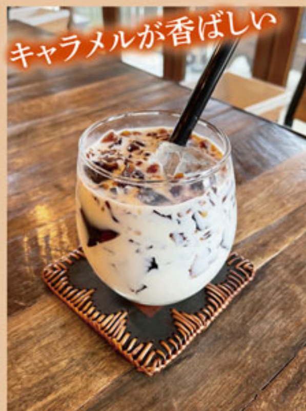
キャラメルコピリッチミルク