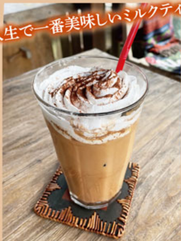
ICE珈琲ミルクティー