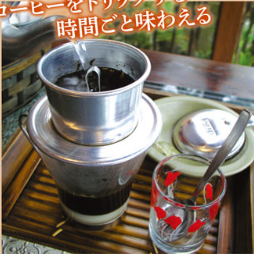
ベトナムコーヒー 550yen

甘い香りを楽しみながら ゆっくりドリップ。 コンデンスミルクで味わうのが本場ベトナム流! (ホットorアイス)