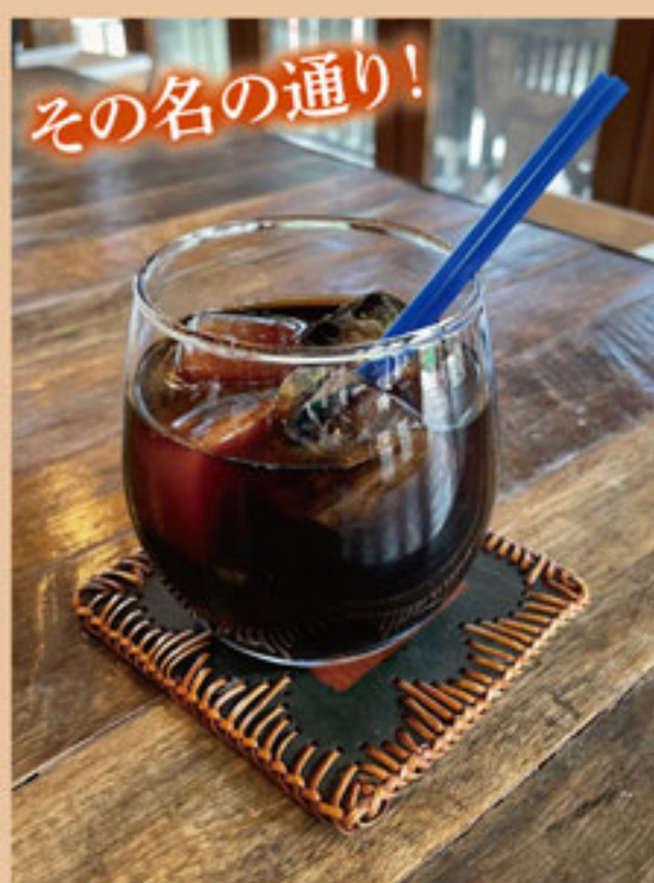
すっきりアイス珈琲