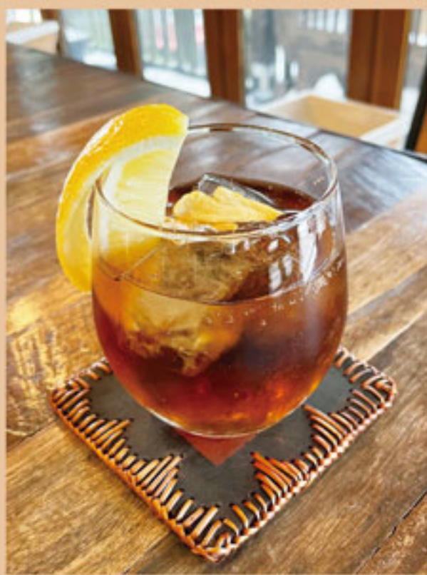
ドライジンジャー