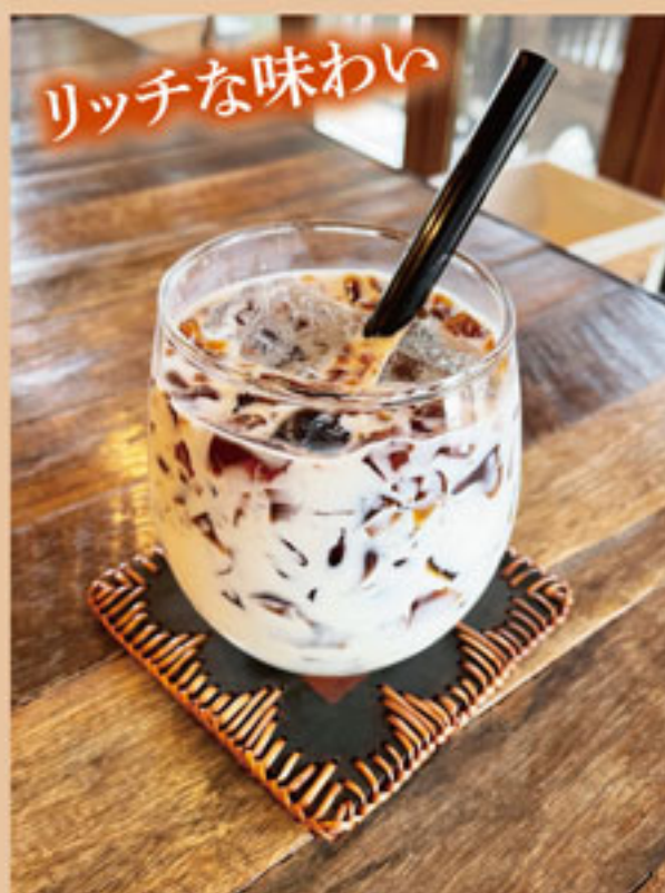
コピリッチミルク