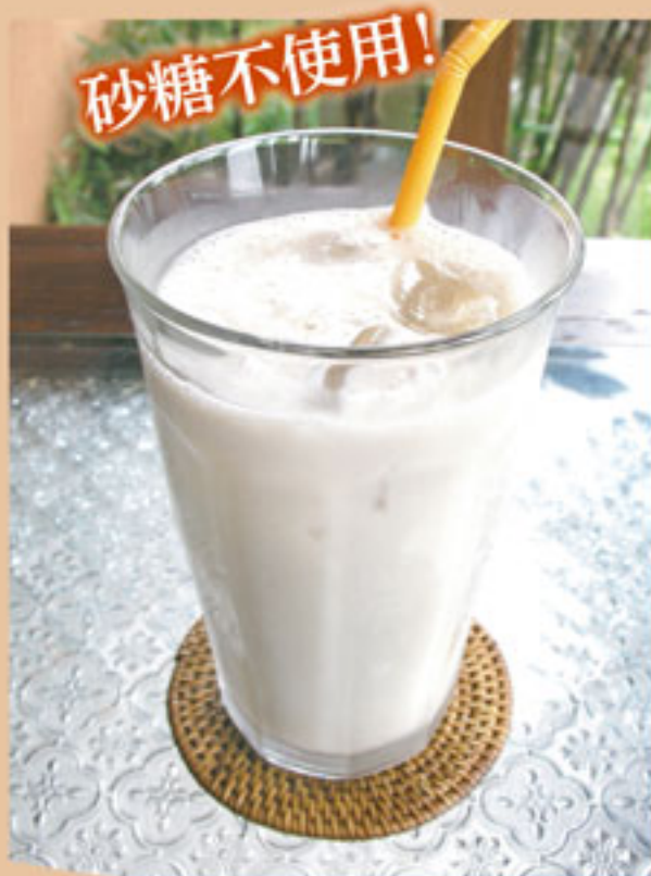
濃厚バナナジュース