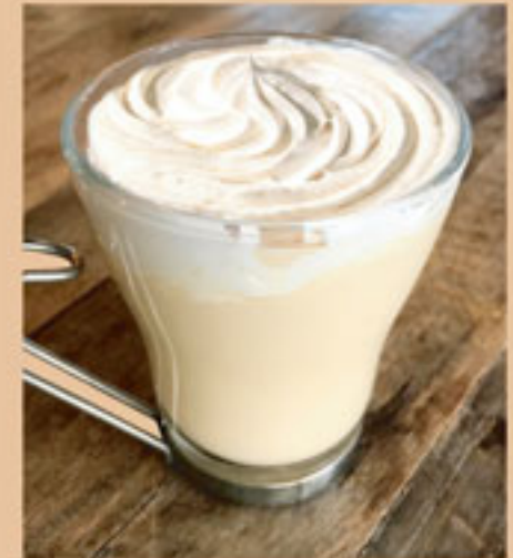
珈琲ミルクティー 550yen

身体の芯からHOTに! 生姜の香りが 口の中いっぱい広がる スパイシーなHOTジンジャーエール